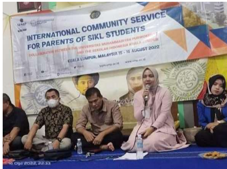
Gambar 1. Ceramah Tim Pelatih

Pada tahapan ini dilakukan pemusatan perhatian para peserta mengenai pengertian Pendidikan karakter dan lainnya Gambar 1 merupakan bukti kegiatan ceramah di tahapan pelaksanaan.