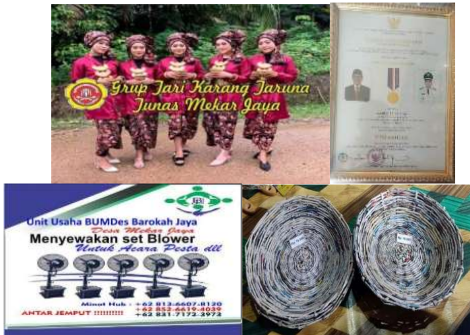
Gambar 2. Penghargaan yang Diterima Desa Mekar Jaya

Desa Mekar Jaya memiliki BUMDES atau Badan Usaha Milik Desa yang memberikan hak ekonomi kepada warga yang memiliki kreatifitas di bidang ekonomi kreatif dengan seperti dengan pemanfaatan Koran bekas menjadi piring untuk kegiatan pernikahan, selain itu juga bergerak di bidang seni kreatifitas tari yang dimiliki warga atau pemuda desa tersebut, serta penyewaan kipas angin untuk kegiatan pesta dan sebagainya sehingga menyebabkan desa ini mendapat julukan desa mandiri pada tahun 2022 yang dipimpin oleh kepala desa bernama Ambo Tuo, S.Ag berikut gambar penghargaan yang diterima desa ini dapat dilihat dalam gambar berikut di bawah ini: