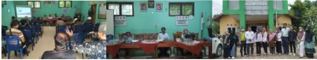
Gambar 1. Pelaksanaan Kegiatan Pengabdian di Desa Mekar Jaya

Berikut adalah kegiatan pengabdian masyarakat mulai dari survey dan pelaksanaan, adapun pelaksanaannya dilaksanakan secara offline adalah pada gambar di bawah ini